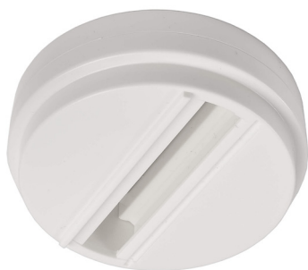
710045 Verkehrsweiß traffic white